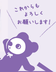
これからもよろしくお願ひします!