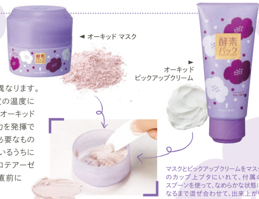
マスクとピックアップクリームをマスクのカップ上フタにのせて、付属のスプーンを使って、なめらかな状態になるまで混ぜ合わせて、出来上がり。

A. タンパク質である酵素は、種類によって、もっとも効果的に働くpHや温度が異なります。たとえば、胃液の中で働く消化酵素ペプシンは、酸性の性質を持ち、37℃程度の温度に保たれた胃液の中にあつてこそ、もっともよく働くことができます。「酵素パック」のオーキッドピックアップクリームは、オーキッドマスクに配合したプロテアーゼが十分に能力を発揮できるように中性付近のpH7に設定されています。また、酵素にとって水分は絶対に必要なものなのですが、プロテアーゼを水に溶かすと不安定な状態になり、長期保管しているうちに能力を失ってしまいます。そのため、水分のないオーキッドマスク(粉)に酵素プロテアーゼを配合し、中性付近に調整したオーキッドピックアップクリーム(水分)を使う直前に混ぜ合わせることで、酵素の効果が最大限に引き出されるのです。