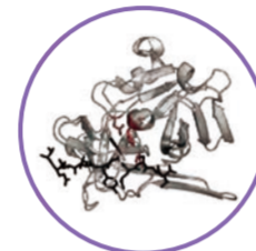
▲プロテアーゼ一例

A. 「口にするための酵素」のほとんどは発酵食品で、微生物が持つ酵素によって発酵されたものであるため、そう呼ばれています。けれど、それらは消化吸収がよくなった栄養素であり、化学的な意味での酵素とは少し異なります。「酵素パック」に使用している酵素は、生き物の体にとって必要な反応を速やかに進めてくれるタンパク質。つまり「本物の酵素」です。特に「酵素パック」には、通常の洗顔アイテムだけでは落としにくいタンパク質汚れ(古い角質)を分解するプロテアーゼが配合されています。